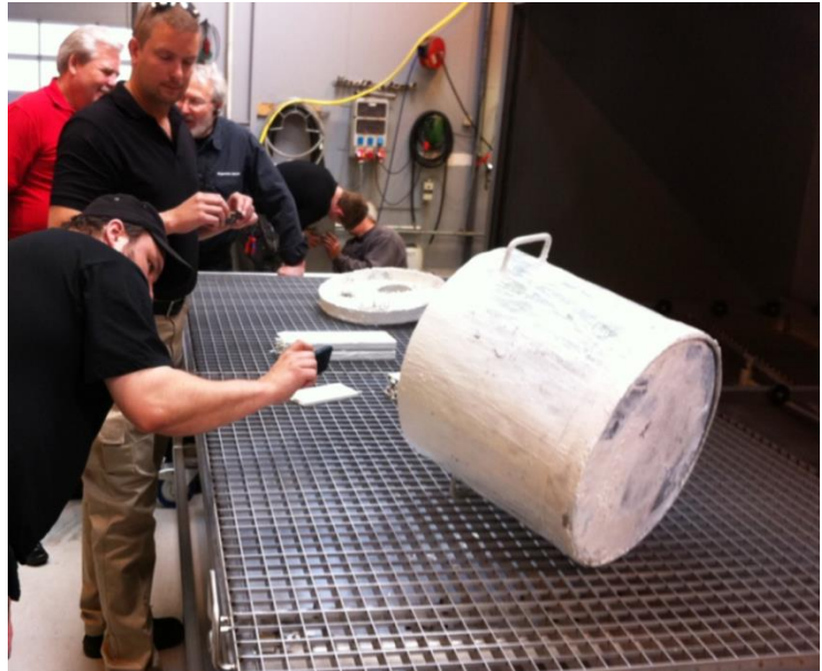
Automatisk tvättmaskin för produktionsutrustning hos IKEA. Älmhult