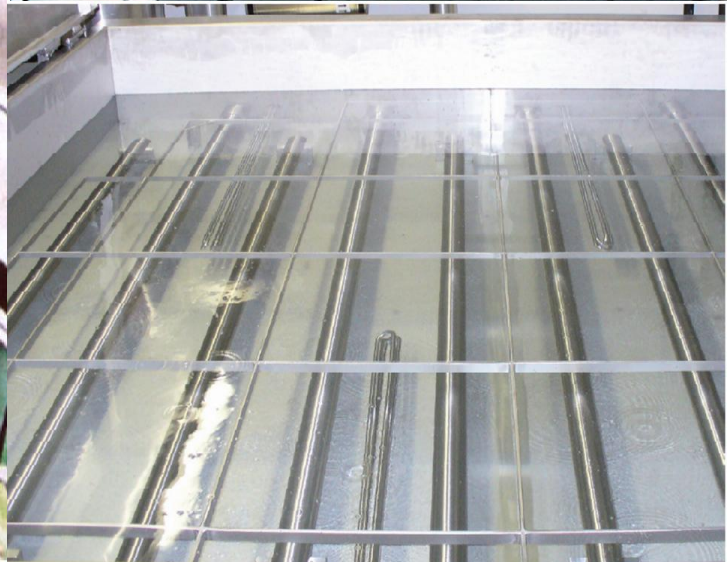
Exempel på montage av Tube resonators