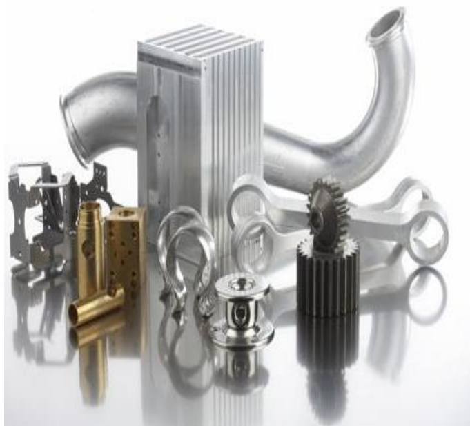
Exempel på komponenter som rengöres i HESÖ spoltvättmaskiner