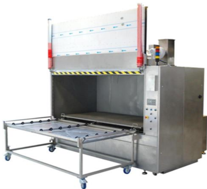
Bilden visar en DF 2600