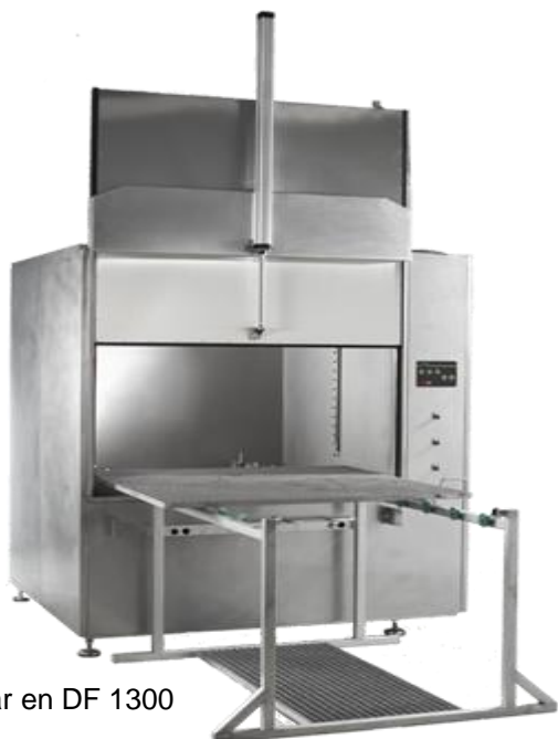
Bilden visar en DF 1300

Övriga storlekar och utföranden på begäran.